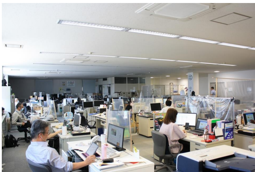
Teams によるリモート視聴の様子