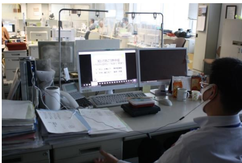
Teams によるリモート視聴の様子